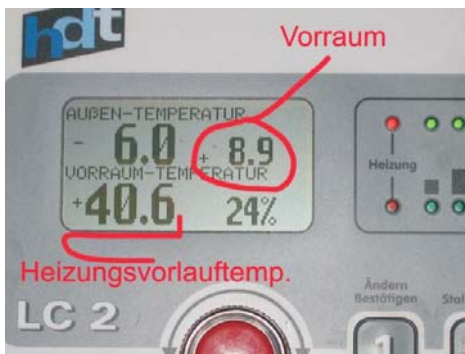
Betrieb Maathuis Hoogstede