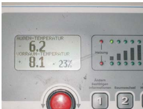
Betrieb Maathuis Hoogstede