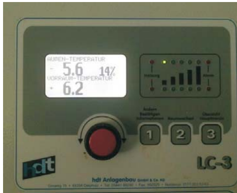
Betrieb Schewe / Rathjens GbR 21726 Oldendorf