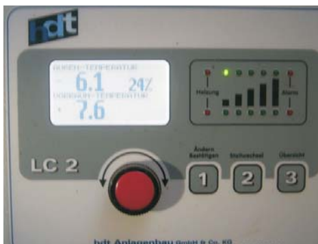
Betrieb Ries Münster-Drieburg