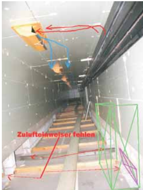
Bild 3: Mangelhafter zentraler Zuluftkanal aus einfachen Extruderplatten, nicht -oder nur mit akrobatischer Leistung-begehrbar. Die Platten wurden nach-träglich mit PU-Schaum zumindestens zu 80% abgedichtet, von der falschen Luftführung gar nicht zu reden.

Der zweite Fall: ein Ferkelaufzuchtstall, Neubau in 2004 mit 8 x 240 Ferkel. Auch hier wurden gravierende Fehler begangen. Die Ausführung der handwerklichen Arbeiten kann hier teilweise nur als mangelhaft bezeichnet werden. Bei diesem Beispiel hat ein großer Stalleinrichter gezeigt, was er von Stallklima versteht.