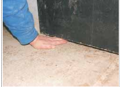
Bild 2: und die Folgen - hier verstärkt, wegen dem unmittelbar dahinter liegenden breiten Schlitz zur Gülle.