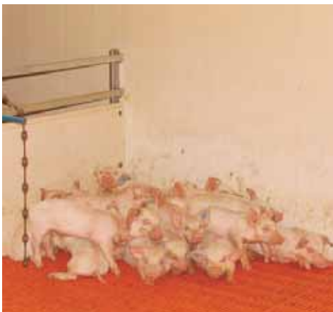
Bild 1: Ferkel in Haufenlage Grund: 32 Grad Raumtemperatur -leider nur unter der Decke-. Zum Zeitpunkt der Messung 26 Grad in Ferkelnähe.

Sie werden sich fragen: Warum ist das so?