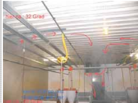
Bild 2: eine sogenannte "diffuse" Decke mit darunter angebrachten Deltarohren haben diese Wirkung. Die Oberflurabsaugung unterstützt den Negativ-Effekt auch noch ein wenig.

Während der Messung und den Rauchproben kamen noch einige andere Fehler zum Vorschein. Der Kardinalfehler war jedoch, die Heizquelle möglichst weit entfernt von den Tieren zu placieren und gleichzeitig die dabei entstehende Wärme mit einer Oberflurabsaugung möglichst schnell wieder zu entfernen.